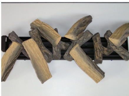
Big-fire 1125 PROPAN