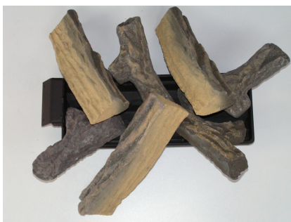
Big-fire 570 PROPAN