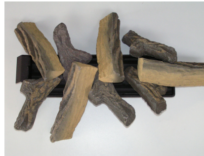
Big-fire 750 PROPAN